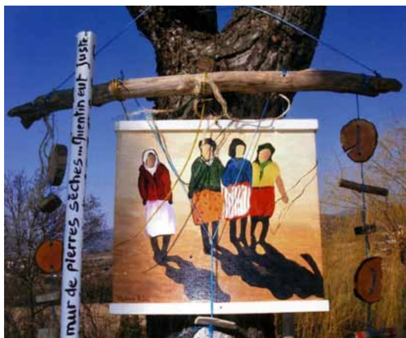
« Le musée sans les murs », 100 œuvres accrochées aux arbres, visibles en toutes saisons.

Conseiller sociologique : Geneviève DAHAN-SELTZER Conseiller parcours : Paul-Noël LAUZIARD